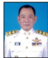
นายphasachet หงษ์ลดาธรรม รองผู้ว่าราชการจังหวัดเชียงราย